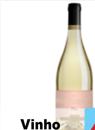
Vinho Branco Dão