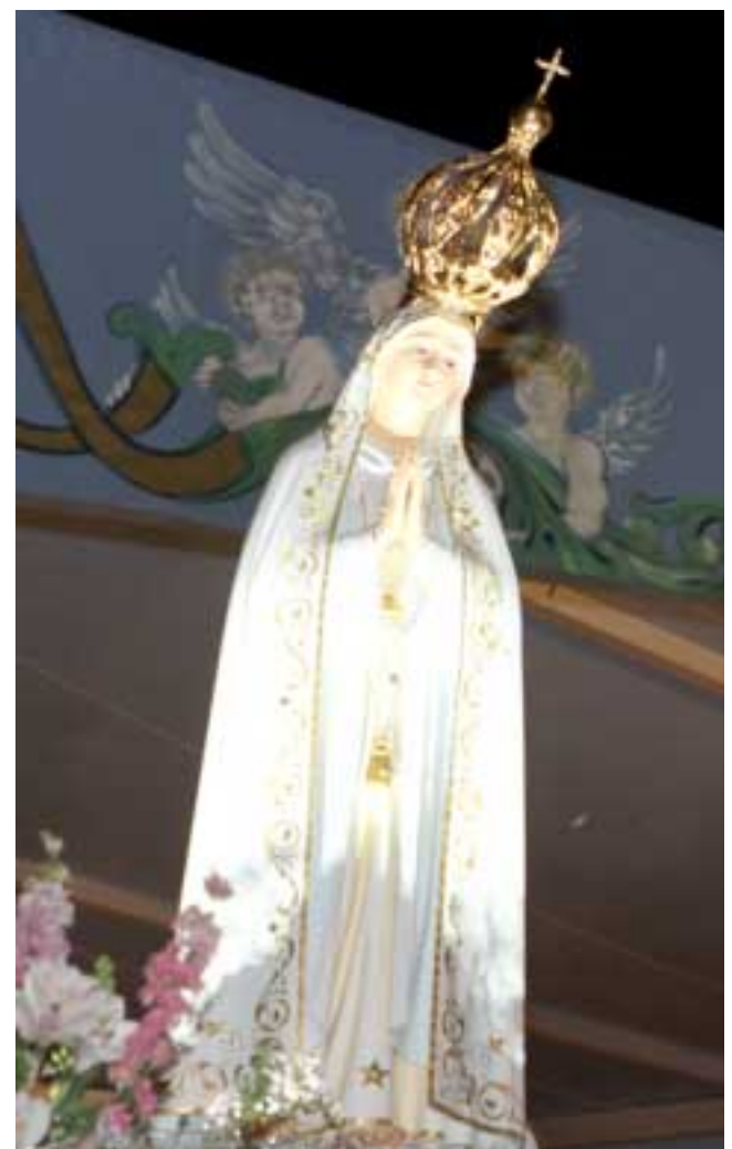
Na foto ao lado, o andor com a imagem da Virgem de Fátima durante a missa campal do passado domingo.