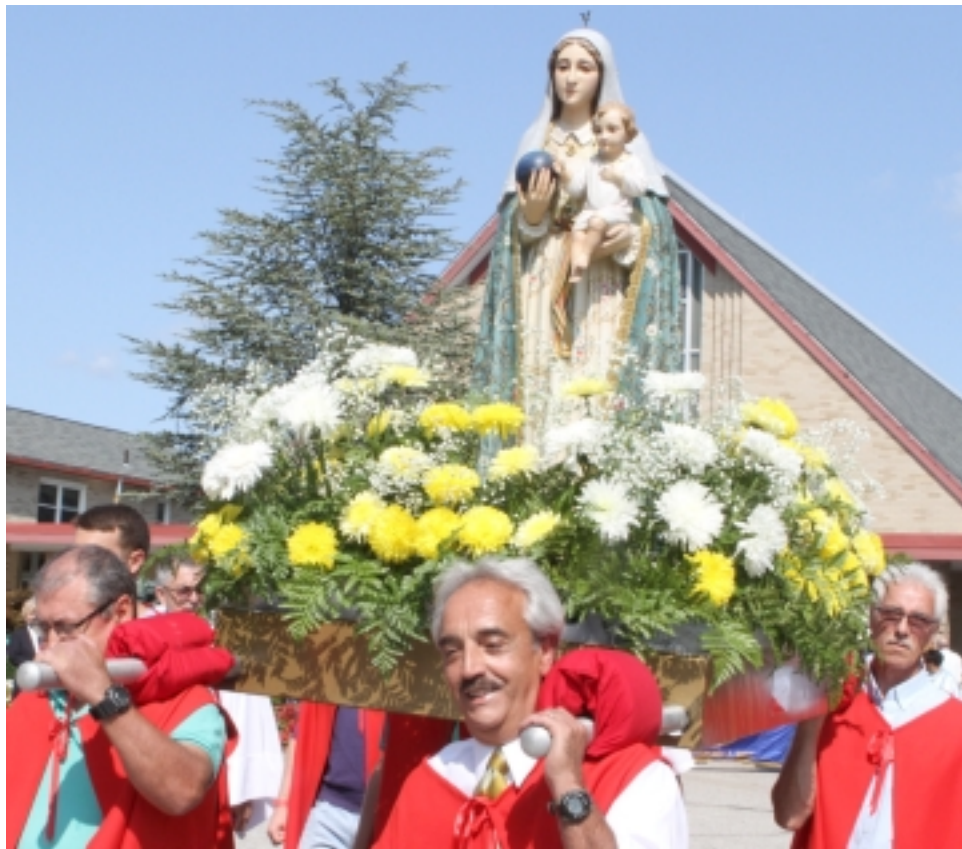
O andor com a imagem de Nossa Senhora do Monte transportado pelos corpos diretivos do Clube Sport União Madeirense de Central Falls.