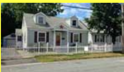
Cape PAWTUCKET $159.900