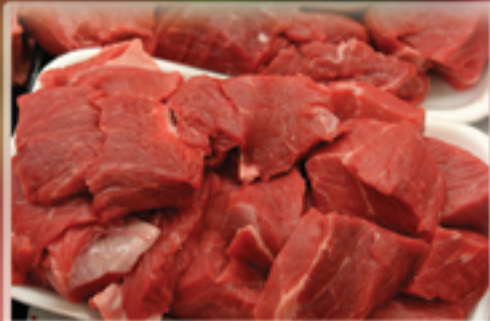
Carne p/ guisar