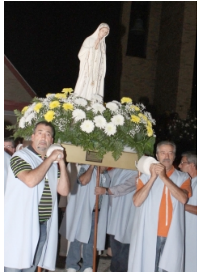
O andor com a imagem de Nossa Senhora de Fátima transportado pelos paroquianos da igreja daquela invocação em Cumberland.