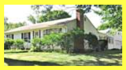
Ranch SOUTH ATTLEBORO $327.900