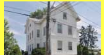
2 Moradias EAST PROVIDENCE $179.900