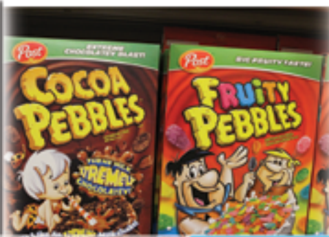
Cereal Cocoa Pebbles