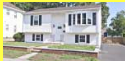
Raised Ranch RIVERSIDE $269.900