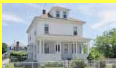
2 Moradias EAST PROVIDENCE $169.900