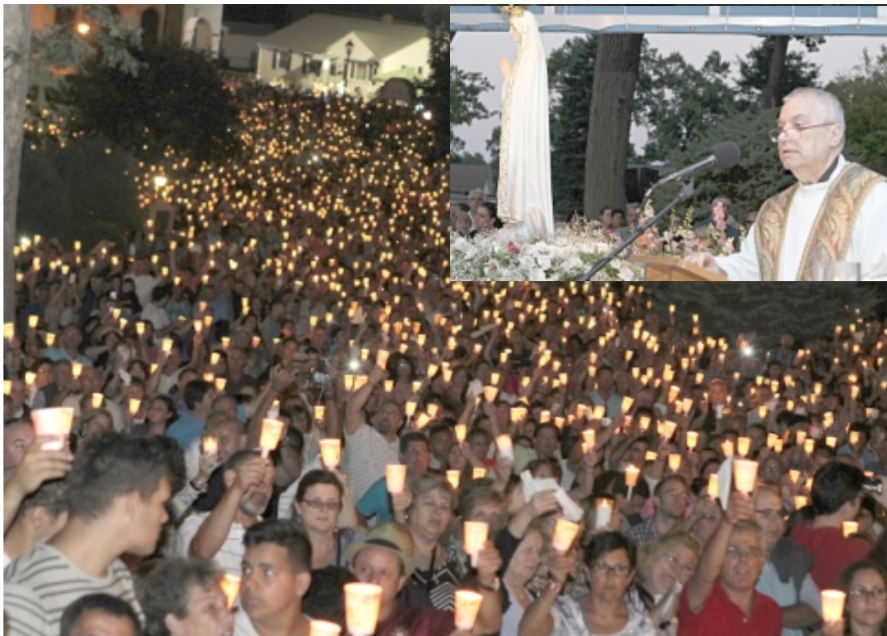
Milhares de pessoas integraram-se na procissão de velas que teve lugar domingo encerrando a 68.ª edição da festa anual do Santuário de Nossa Senhora de Fátima em Ludlow, Mass.