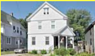
Colonial EAST PROVIDENCE $209.900