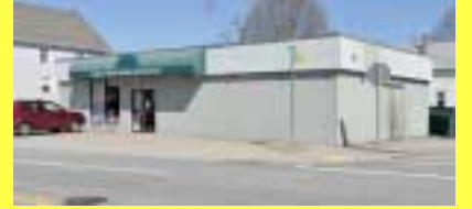
Comercial EAST PROVIDENCE $199.900