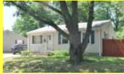
Ranch RUMFORD $169.900