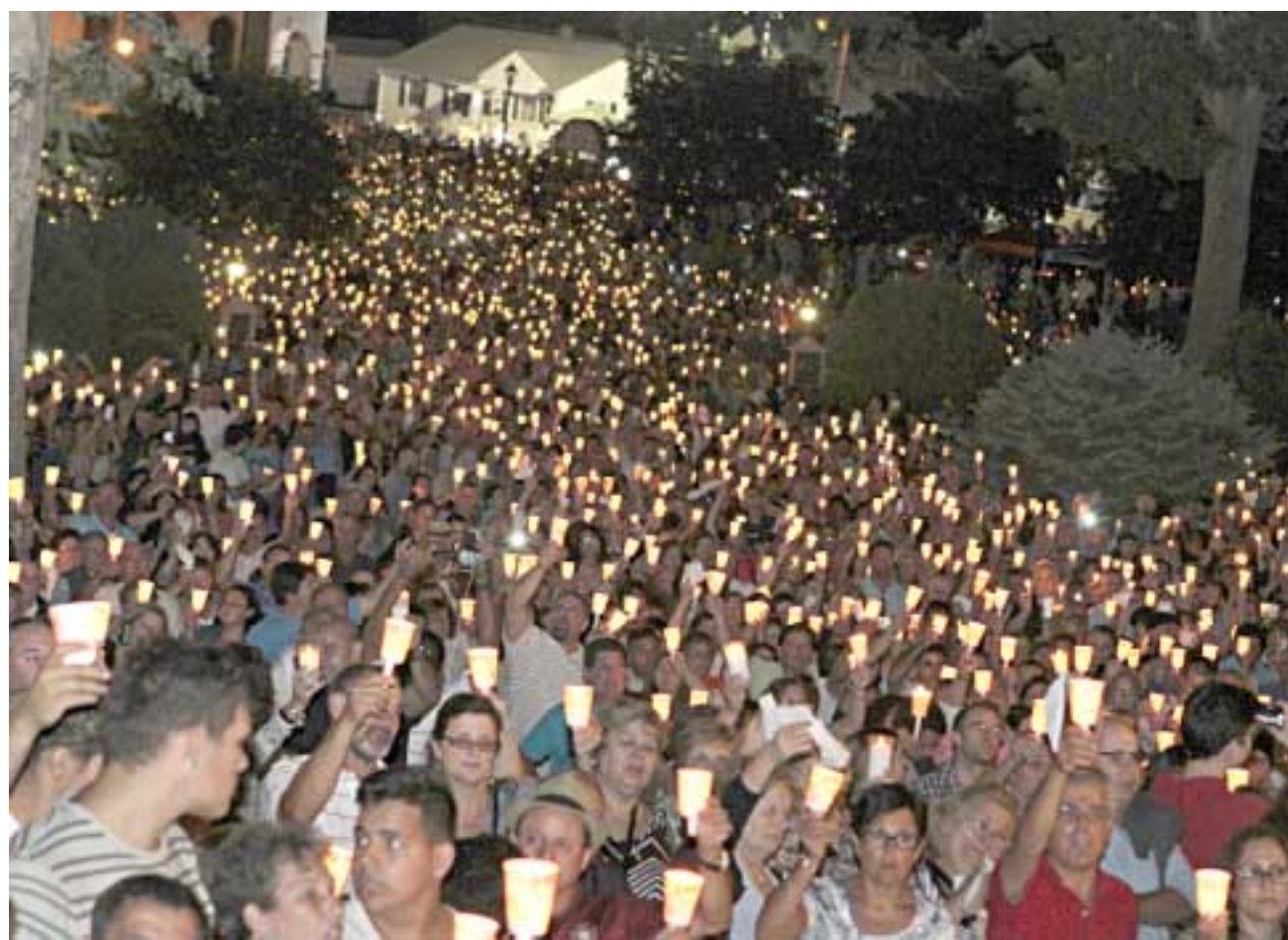
Milhares de fiéis acompanharam a imagem da Virgem de Fátima na noite do passado domingo em Ludlow.