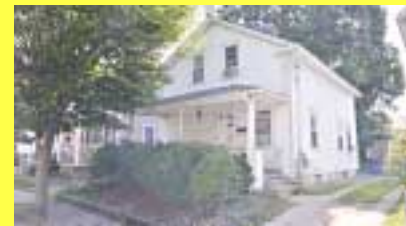
Cottage EAST PROVIDENCE $139.900