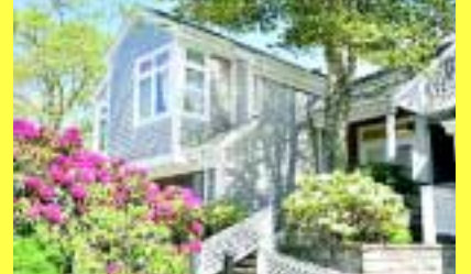
Condominium FALMOUTH/CAPE COD $489.900