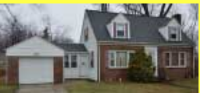
Cape CRANSTON $209.900