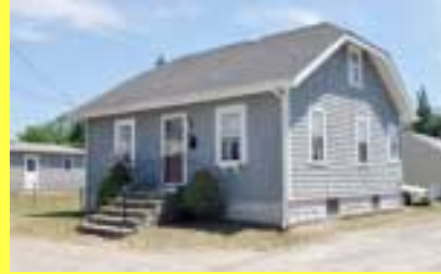
Cape RIVERSIDE $149.900