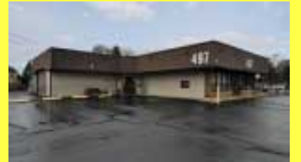
Comercial RIVERSIDE $319.900