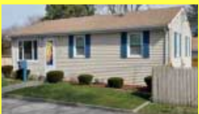
Ranch EAST PROVIDENCE $209.900