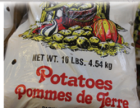
Batata Saco 10 lbs