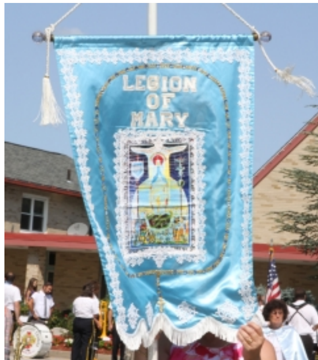
O guião da Legião de Maria