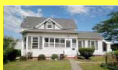
Cottage EAST PROVIDENCE $184.900