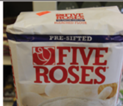
Farinha 5 Roses