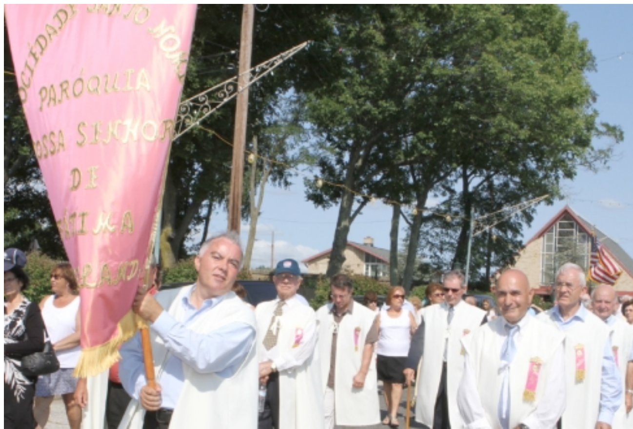
O guião da festa de Nossa Senhora de Fátima em Cumberland à saída da igreja. Na foto abaixo, o grupo das Amigas de Penalva.