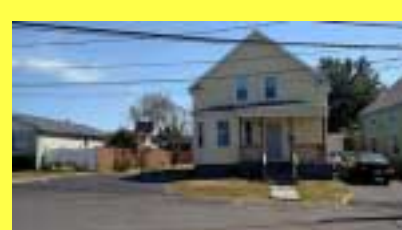
Cottage CRANSTON $169.900