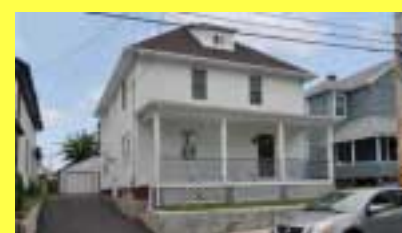
Colonial EAST PROVIDENCE $239.900