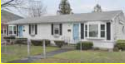
Duplex RIVERSIDE $179.900

• Várias casas à venda • Preços baixos • Juros continuam baixos