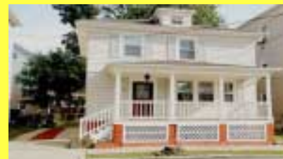
Colonial PROVIDENCE $179.900