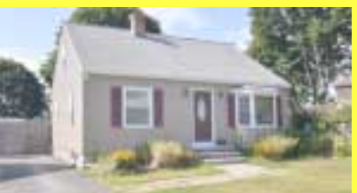
Cape RIVERSIDE $189.900